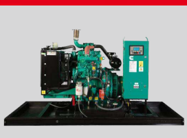
CUMMINS MODEL: QSB6.7-G17