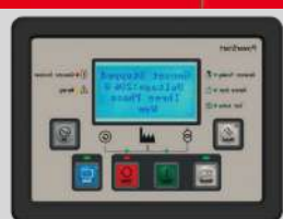
POWERSTART MODEL: PS0602