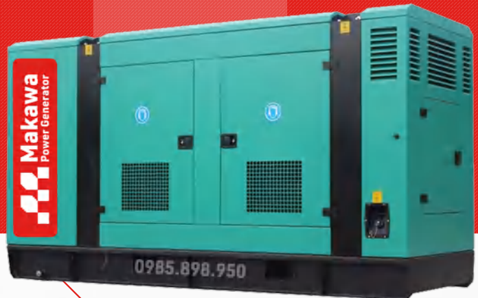
Máy có vỏ chống ồn

Công ty TNHH TBCN MAKAWA hân hạnh gửi đến Quý cơ quan các đặc tính kỹ thuật máy phát điện của hãng model MKW-313CS như sau: