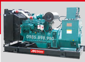
CUMMINS MODEL: 6LTAA9.5-G1