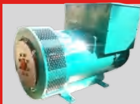
LEROY SOMER MODEL: TAL-A46-F