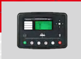
DEESEA MODEL: DSE6120