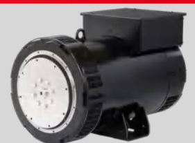
LEROY SOMER MODEL: TAL-A46-F