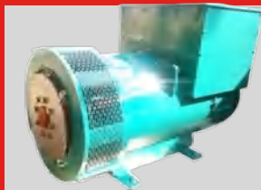
STAMFORD MODEL: PI734B