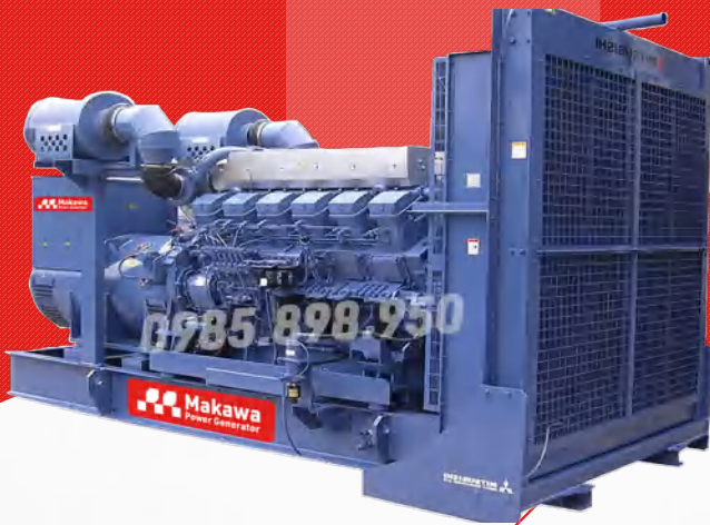
Máy trần I