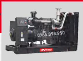
MITSUBISHI MODEL: S12R-PTA-C