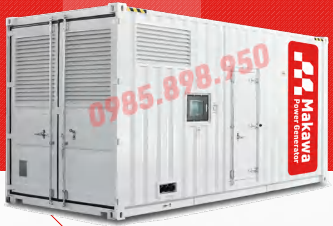
Máy có vỏ chống ồn

Công ty TNHH TBCN MAKAWA hân hạnh gửi đến Quý cơ quan các đặc tính kỹ thuật máy phát điện của hãng model MKW-1250MS như sau: