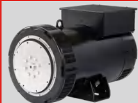
LEROY SOMER MODEL: LSA 50.2 M6