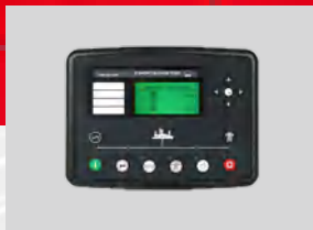
DEESEA MODEL: DSE7320