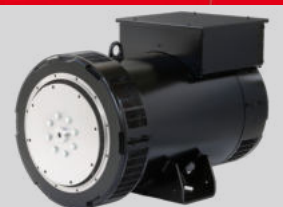
HS STAMFORD MODEL: S5L1D-H4