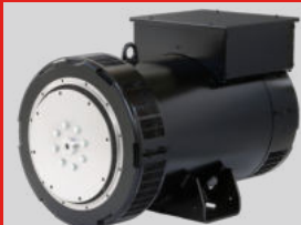
HS STAMFORD MODEL: S5L1D-H4