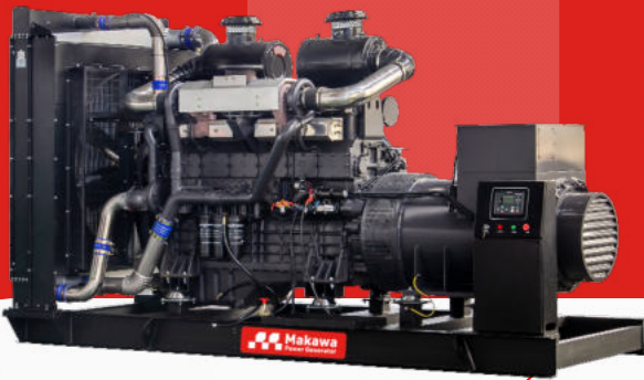
Máy trần I