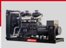
SDEC MODEL: 6KTAA25-G33