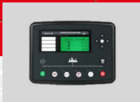
DEESEA MODEL: DSE7320