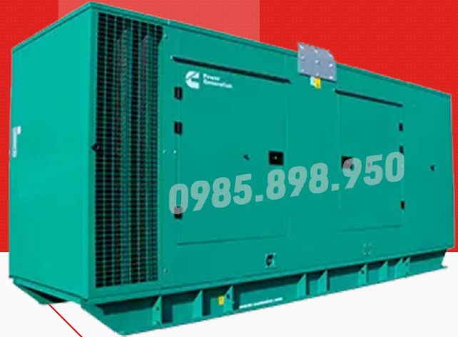
Máy có vỏ chống ồn

Công ty TNHH TBCN MAKAWA hân hạnh gửi đến Quý cơ quan các đặc tính kỹ thuật máy phát điện của hãng model C450D5 như sau: