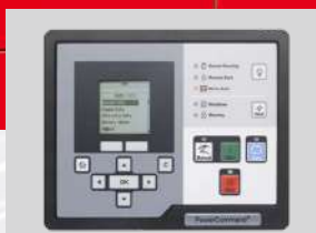
POWERCOMMAND MODEL: PC 2.2