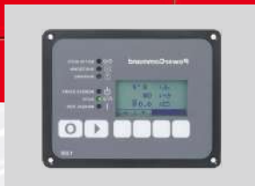
POWERCOMMAND 1.1 MODEL: PC 1.1