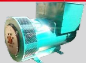
STAMFORD MODEL: UC274J