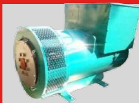
STAMFORD MODEL: UCI274H