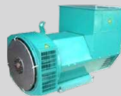
STAMFORD MODEL: UCI274H