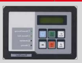
POWERSTART 0500 MODEL: PS0500