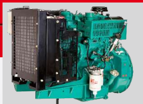
CUMMINS MODEL: X2.5G2