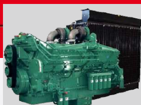
CUMMINS MODEL: QSK60-GS3