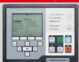
POWERCOMMAND MODEL: PC 3.3