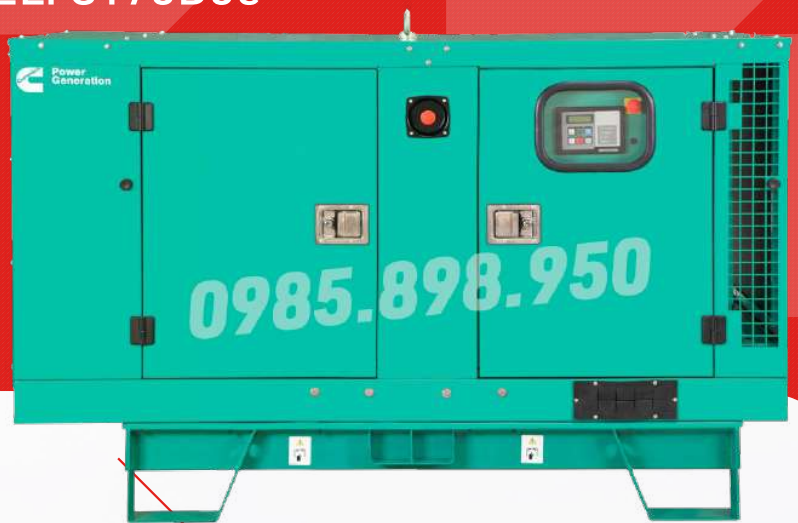
Máy có vỏ chống ồn

Công ty TNHH TBCN MAKAWA hân hạnh gửi đến Quý cơ quan các đặc tính kỹ thuật máy phát điện của hãng model C175D5e như sau: