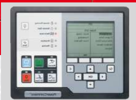
POWERCOMMAND MODEL: PC 1.2