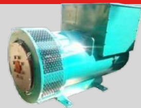
STAMFORD MODEL: UCI274F