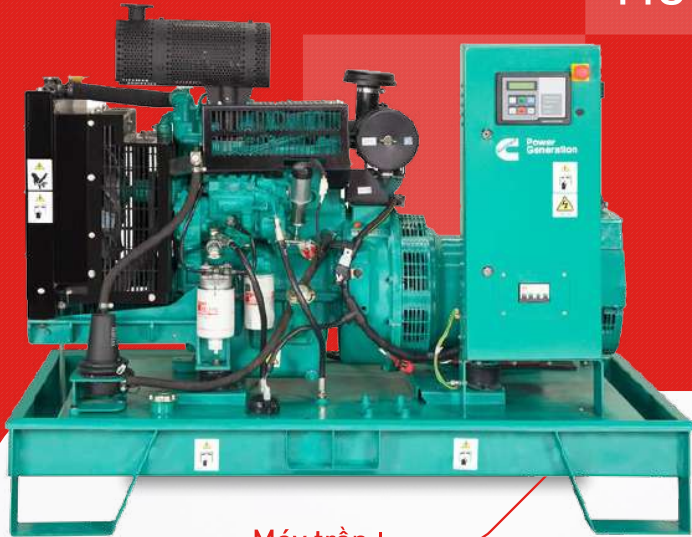
Máy trần I