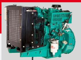
CUMMINS MODEL: X1.3G2