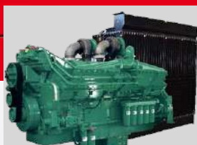
CUMMINS MODEL: QST30-G4