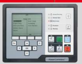
POWERCOMMAND MODEL: PC 3.3