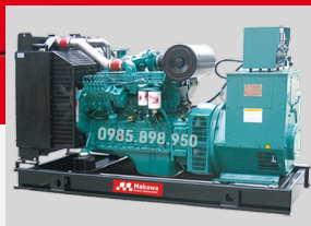
CUMMINS MODEL: QSZ13-G6