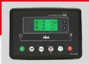
DEESEA MODEL: DSE6120