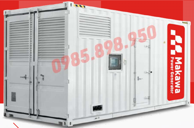
Máy có vỏ chống ồn

Công ty TNHH TBCN MAKAWA hân hạnh gửi đến Quý cơ quan các đặc tính kỹ thuật máy phát điện của hãng model MKW-1600ML như sau: