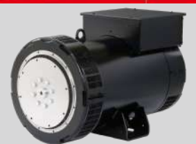
LEROY SOMER MODEL: LSA 50.2 VL10