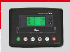
DEESEA MODEL: DSE7320