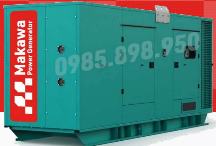
Máy có vỏ chống ồn

Công ty TNHH TBCN MAKAWA hân hạnh gửi đến Quý cơ quan các đặc tính kỹ thuật máy phát điện của hãng model MKW-713CS như sau: