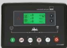
DEESEA MODEL: DSE7320