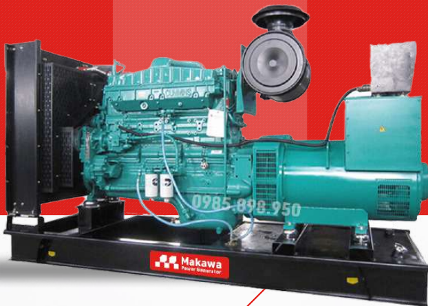
Máy trần I