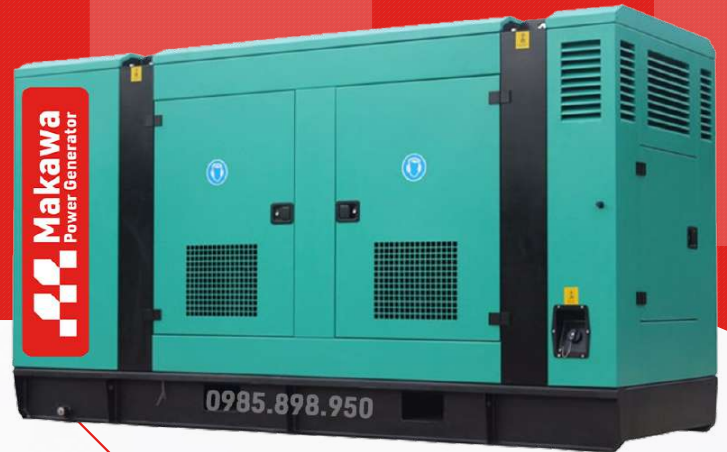
I Máy có vỏ chống ồn

Công ty TNHH TBCN MAKAWA hân hạnh gửi đến Quý cơ quan các đặc tính kỹ thuật máy phát điện của hãng model MKW-50CS như sau: