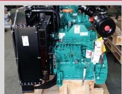
CUMMINS MODEL: 4BTA3.9-G2