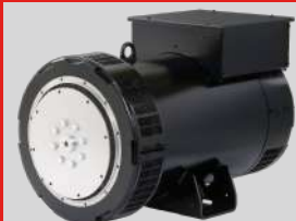
LEROY SOMER MODEL: TAL-A42-G