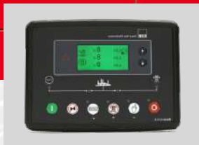
DEESEA MODEL: DSE7320