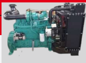
CUMMINS MODEL: 6CTAA8.3-G2