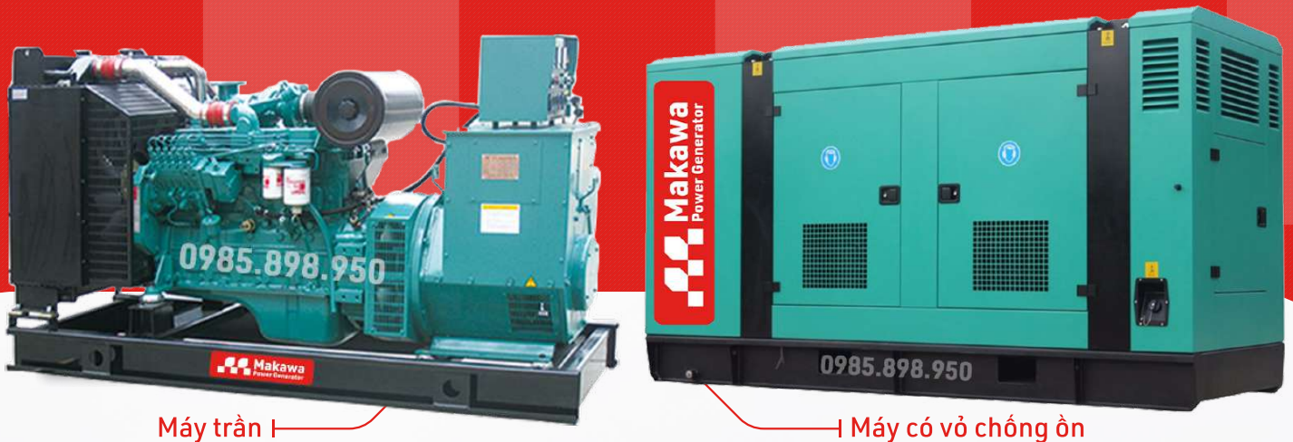
Máy trần I