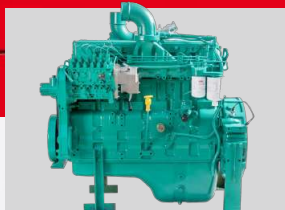
CUMMINS MODEL: 6BTA5.9-G2