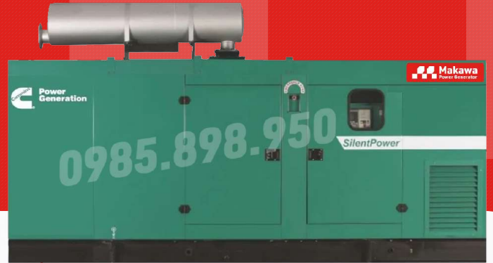
Máy có vỏ chống ồn

Công ty TNHH TBCN MAKAWA hân hạnh gửi đến Quý cơ quan các đặc tính kỹ thuật máy phát điện của hãng model C910D5P như sau: