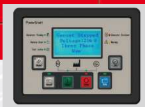
POWERSTART MODEL: PS0601