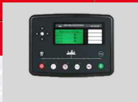
DEESEA MODEL: DSE7320