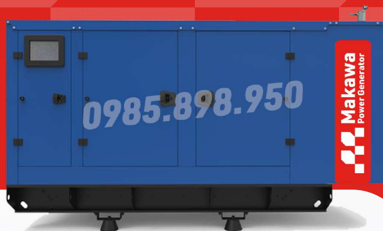
Máy có vỏ chống ồn

Công ty TNHH TBCN MAKAWA hân hạnh gửi đến Quý cơ quan các đặc tính kỹ thuật máy phát điện của hãng model MKW-80BS như sau: