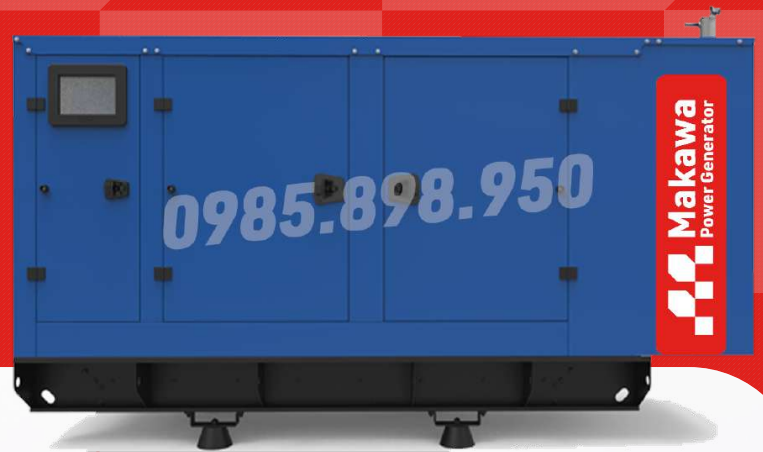
Máy có vỏ chống ồn

Công ty TNHH TBCN MAKAWA hân hạnh gửi đến Quý cơ quan các đặc tính kỹ thuật máy phát điện của hãng model MKW-65BS như sau: