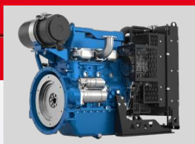
BAUDOIN MODEL: 4M10G70/5