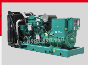
CUMMINS MODEL: KTAA19-G13