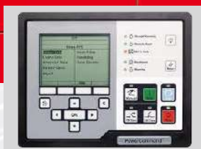
POWERCOMMAND MODEL: PC3.3