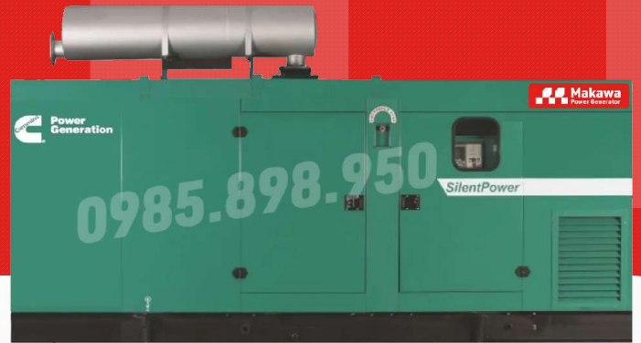
Máy có vỏ chống ồn

Công ty TNHH TBCN MAKAWA hân hạnh gửi đến Quý cơ quan các đặc tính kỹ thuật máy phát điện của hãng model C625D5P như sau: