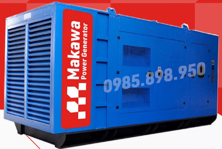
Máy có vỏ chống ồn

Công ty TNHH TBCN MAKAWA hân hạnh gửi đến Quý cơ quan các đặc tính kỹ thuật máy phát điện của hãng model MKW-600BS như sau: