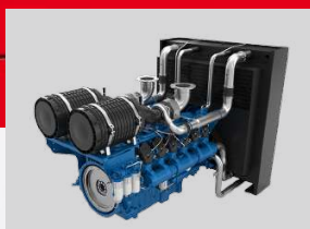
BAUDOIN MODEL: 8M21G660/5