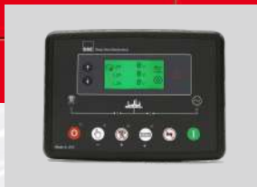
DEESEA MODEL: DSE6020