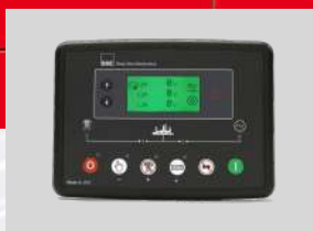
DEESEA MODEL: DSE6020