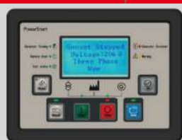
POWER START MODEL: PS0602