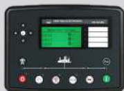
DEESEA MODEL: DSE7320