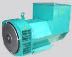
STAMFORD MODEL: S7L1D-J