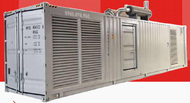
Máy có vỏ chống ồn

Công ty TNHH TBCN MAKAWA hân hạnh gửi đến Quý cơ quan các đặc tính kỹ thuật máy phát điện của hãng model MKW-2250MS như sau: