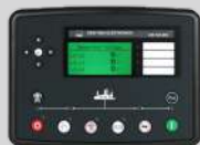
DEESEA MODEL: DSE7320