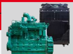
BAUDOIN MODEL: 4M06G20/5