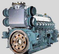
MITSUBISHI MODEL: S16R-PTAA2-C