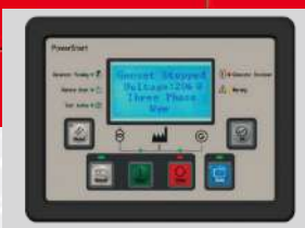
POWER START MODEL: PS0602