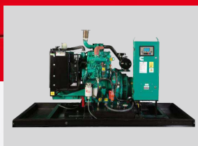
CUMMINS MODEL: QSB6.7-G14