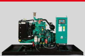
CUMMINS MODEL: QSB5.9-G2