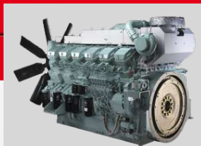
MITSUBISHI MODEL: S12R-PTAA2-C