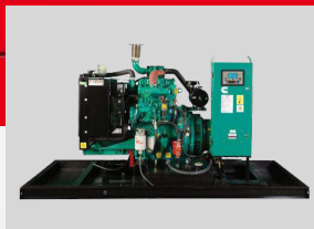
CUMMINS MODEL: QSB5.9-G1