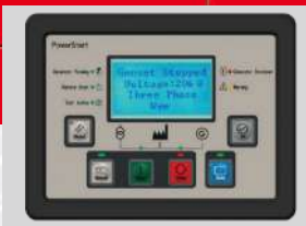
POWER START MODEL: PS0602