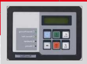
POWERSTART MODEL: PS0500