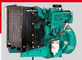
CUMMINS MODEL: X1.3TAA-G1