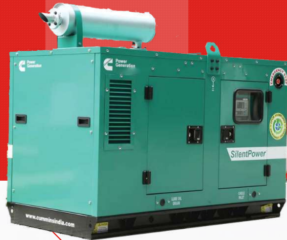
Máy có vỏ chống ồn

Công ty TNHH TBCN MAKAWA hân hạnh gửi đến Quý cơ quan các đặc tính kỹ thuật máy phát điện của hãng model C10D5P như sau: