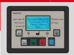
POWERSTART MODEL: PS 0600