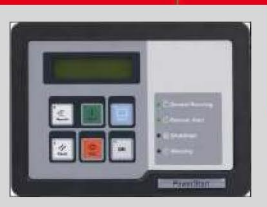
POWERSTART MODEL: PS 0600