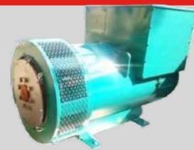
STAMFORD MODEL: S3L1D-C41