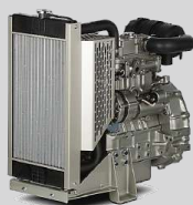
PERKINS MODEL: 1104A-44TG2