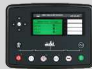
DEESEA MODEL: DSE7320