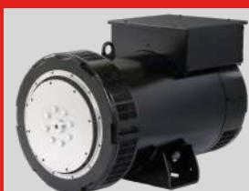
LEROY SOMER MODEL: LSA 52.3 L9