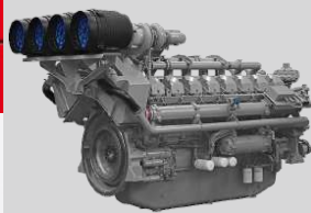
PERKINS MODEL: 4016-61TRG3