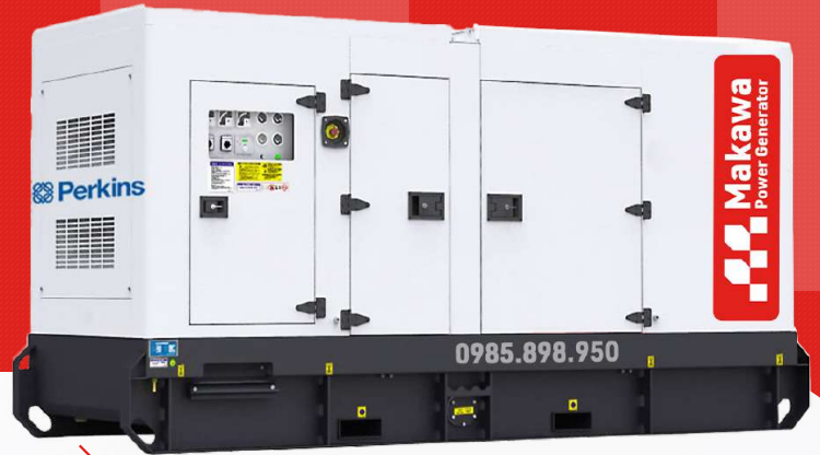
Máy có vỏ chống ồn

Công ty TNHH TBCN MAKAWA hân hạnh gửi đến Quý cơ quan các đặc tính kỹ thuật máy phát điện của hãng model MKW-135PS như sau: