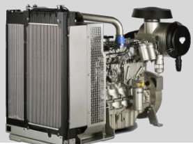
PERKINS MODEL: 1106A-70TG1