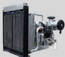
PERKINS MODEL: 4012-46TWG2A