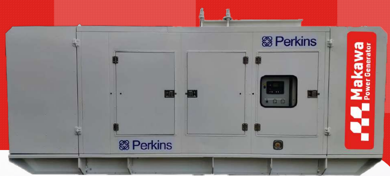
Máy có vỏ chống ồn

Công ty TNHH TBCN MAKAWA hân hạnh gửi đến Quý cơ quan các đặc tính kỹ thuật máy phát điện của hãng model MKW-1125PS như sau: