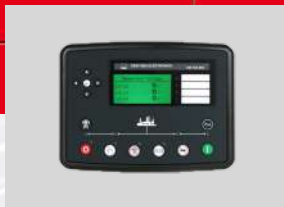
DEESEA MODEL: DSE7320