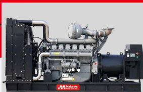
PERKINS MODEL: 2806C-E18TAG1A